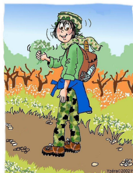
Les plaisirs de la campagne .....